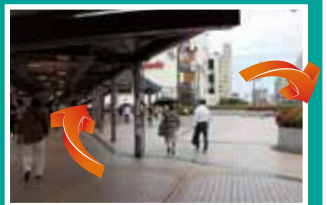
右奥の階段を下へ