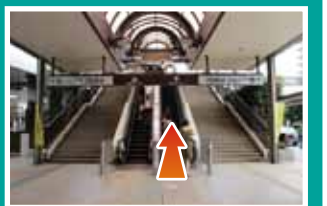
エスカレーターを上へ