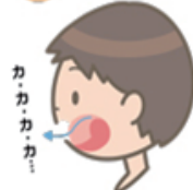
カ 口蓋の奥に舌の付け根付近をつける